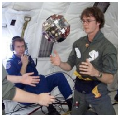
Studenti del MIT che collaudano un prototipo del robot SPHERES

Tre SPHERES in volo libero lavorano insieme all'interno della Stazione Spaziale. Sono indipendenti, ciascuna con la propria energia, i loro propulsori, i computer e i sistemi di navigazione. I risultati ottenuti con questi SPHERES sono importanti per la manutenzione, l'assemblaggio di satelliti, lo studio delle manovre di attracco (docking) e il volo di formazione.