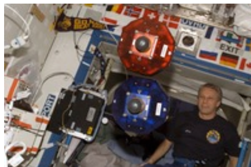
L'astronauta Thomas Reiter con gli SPHERES