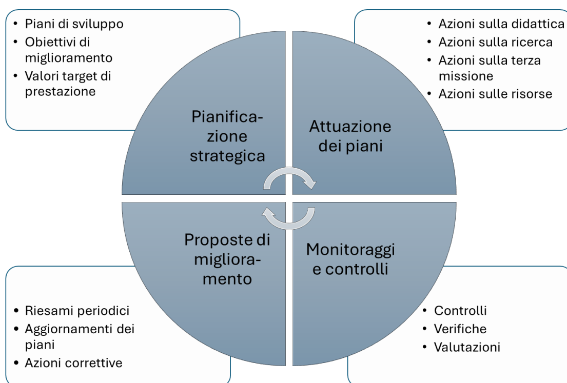
Figura 1: la 4 fasi del Sistema di Assicurazione Qualità del DII secondo il modello P-D-C-A.

La figura 1 riassume gli elementi principali di cui si compone il Sistema di Assicurazione Qualità del DII.